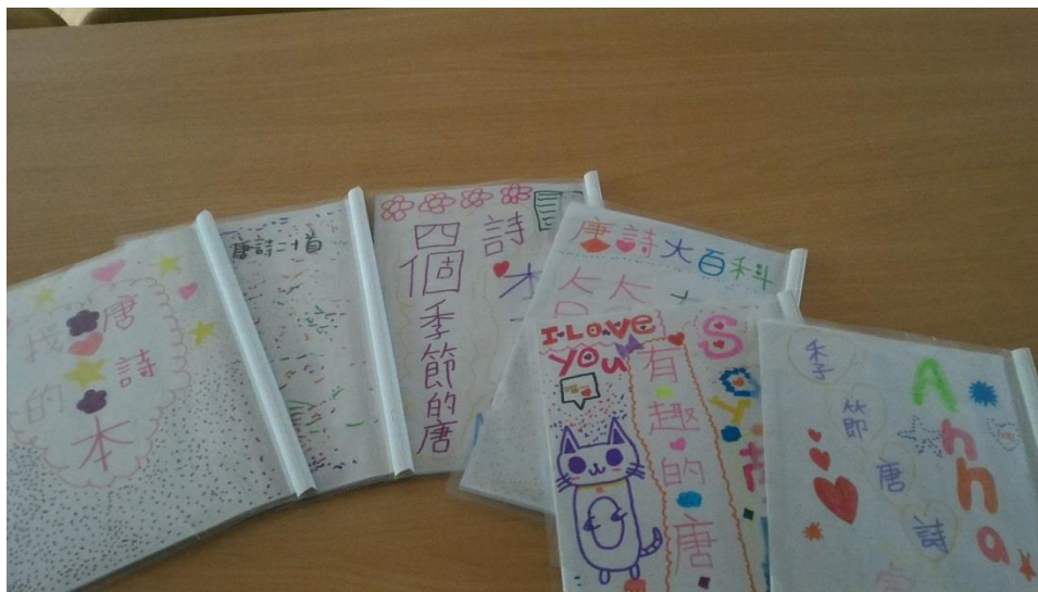
表六：唐詩學習單封面設計